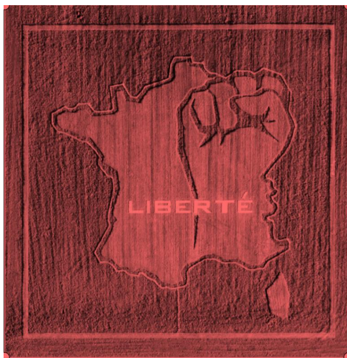
Land Art « LIBERTE » - Franck Bonneau – Land Art & Co

Dossier mettant en avant le fonctionnement systémique d'une gouvernance de l'ombre. En partant de cycles de vie de la serpula lacrymans et par extension le Blob, les sept présidences s'inscrivent non pas dans un schéma d'alternance ponctuées par des élections ; mais bien dans une planification antérieure même à la première version de la Constitution de la Vème République. Un fonctionnement comparable aux courses de relais où chaque présidence est choisie pour un rôle préétabli fin de préparer le terrain pour son successeur. Conformément aux objectifs sur lesquels planchent les loges, les sociétés hermétiques affiliées ou parfois les académies. Le tout s'inscrivant dans un découpage précis en base 7 et conjoint au cartel mondialiste.