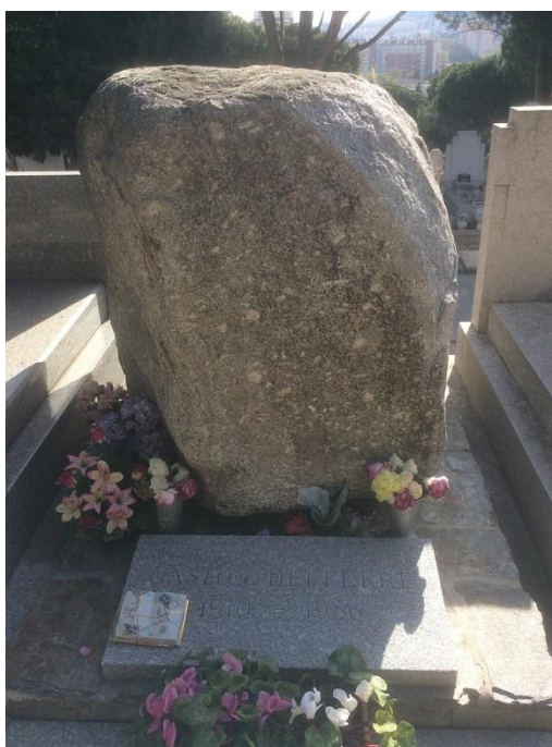
La tombe de Gaston Defferre au cimetière Saint-Pierre.